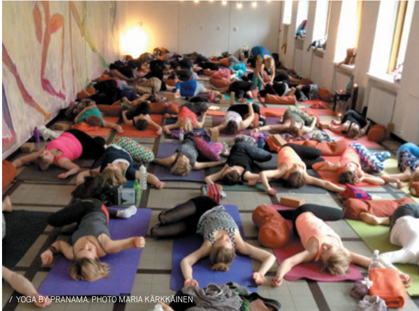
/ YOGA BY PRANAMA.