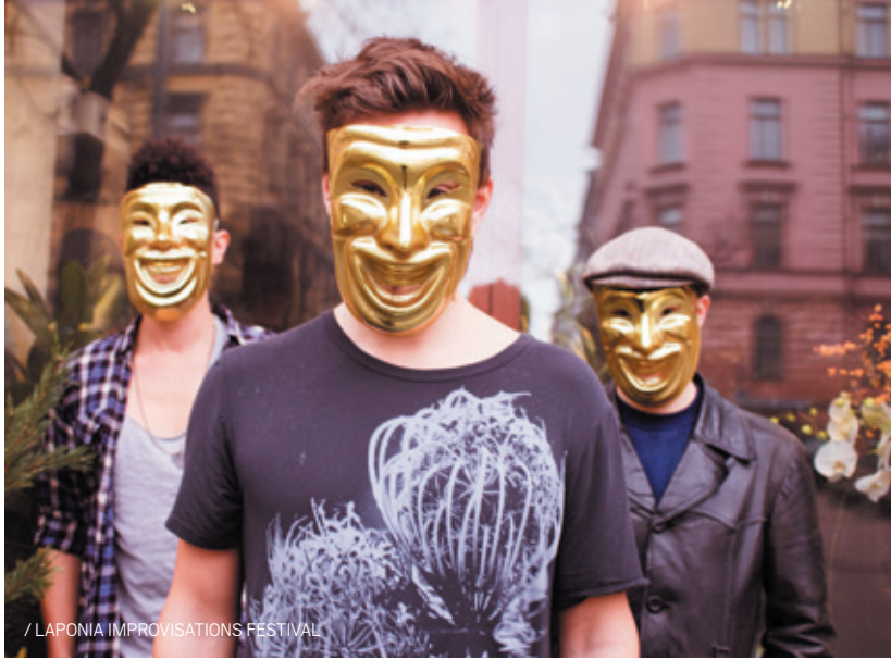
/ LAPONIA IMPROVISATIONS FESTIVAL